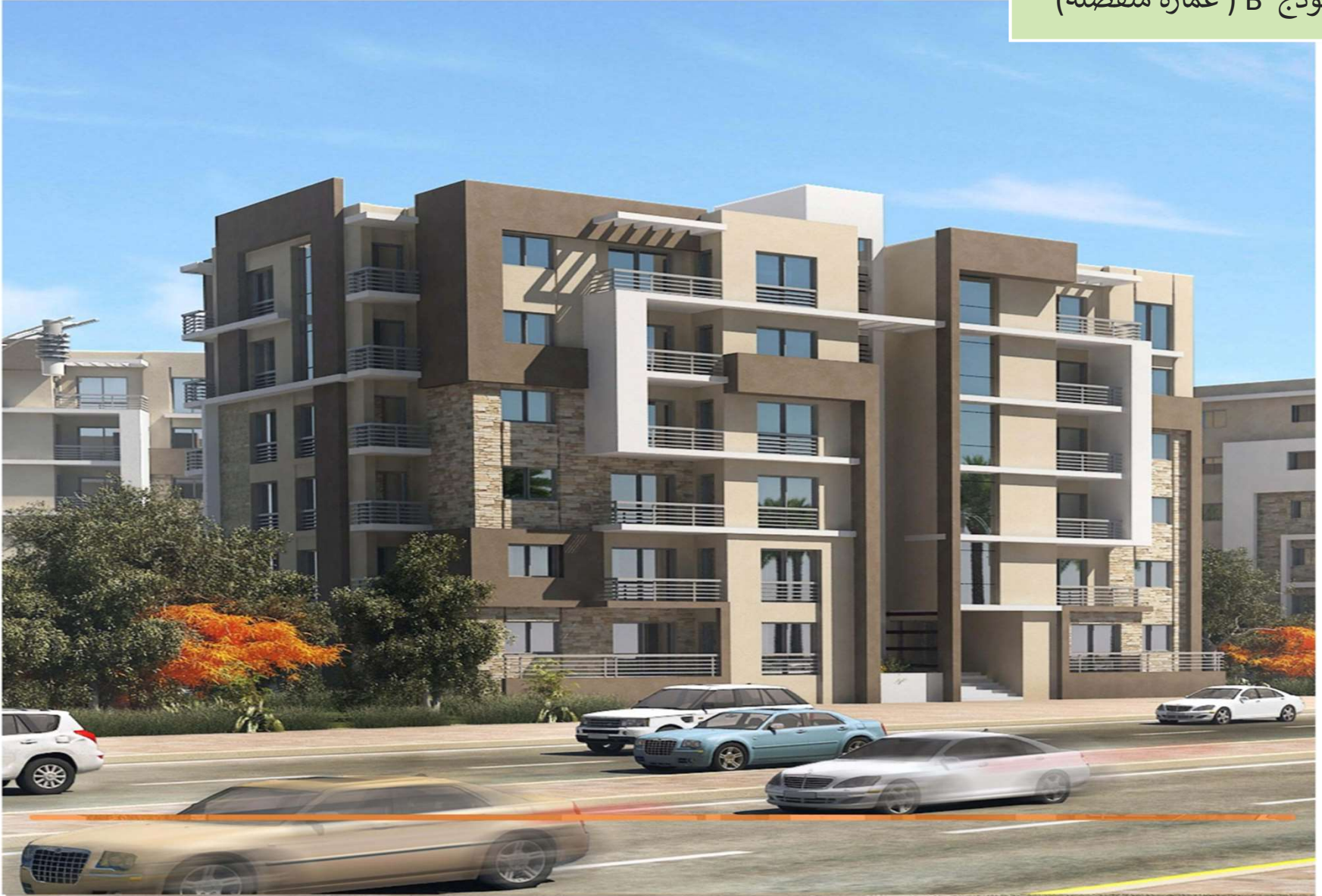
نموذج B ( عمارة منفصلة )