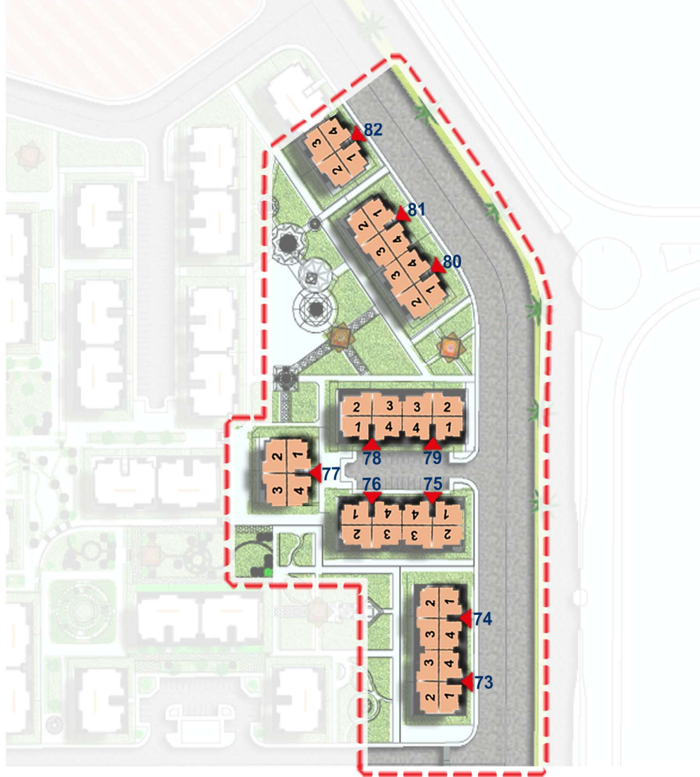
مخطط عام لتوضيح توزيع العمارات وترقيمها فقط (ولا يعد به في غير ذلك)