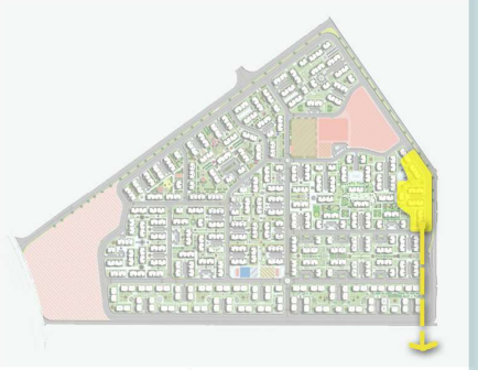
العمارات موضوع الطرح بالنسبة للمخطط العام