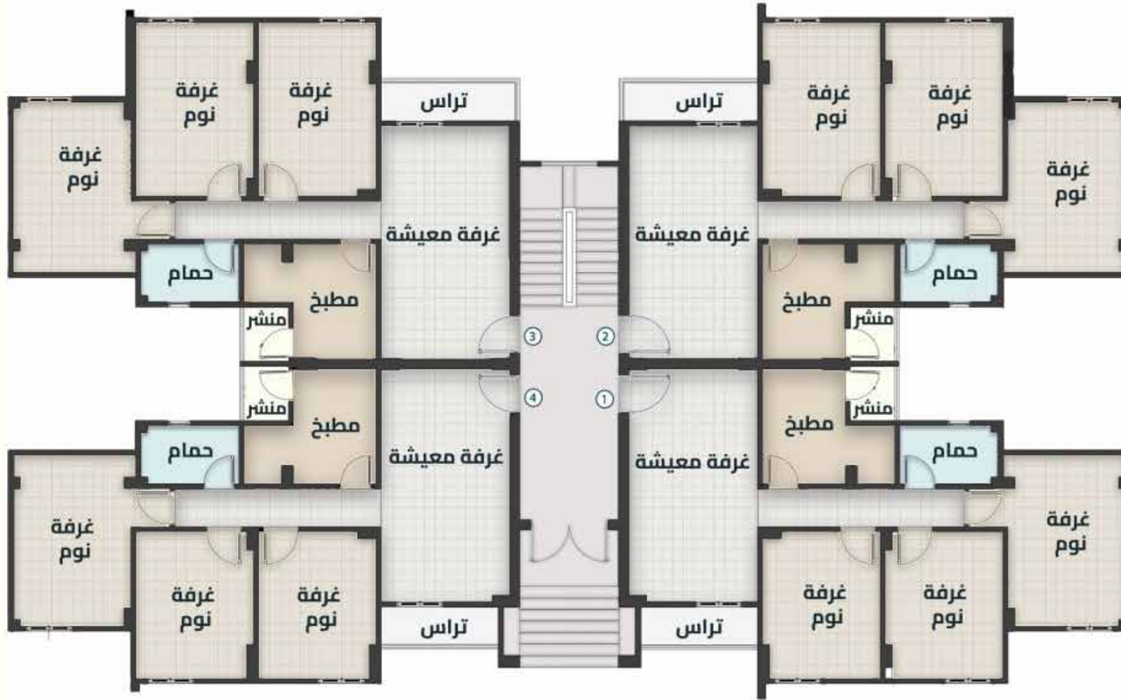
مسقط أفقي للدور (الأرضي)