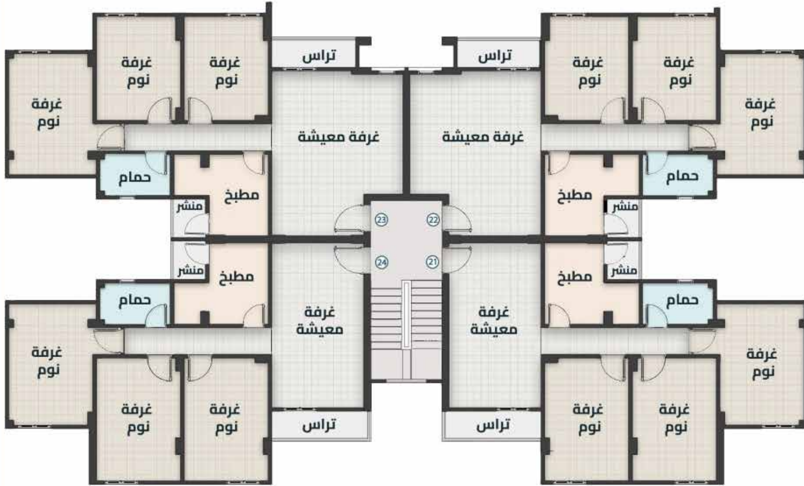
مسقط أفقي للدور (الآخر)