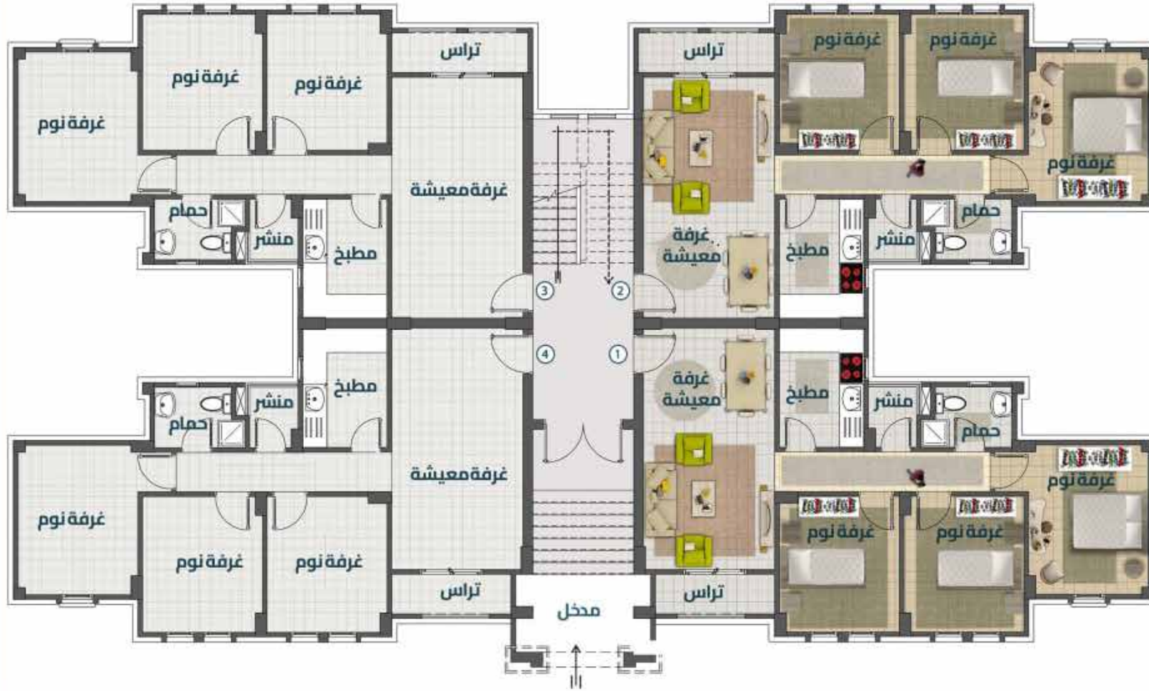
مسقط أفقي للدور (الأرضي)