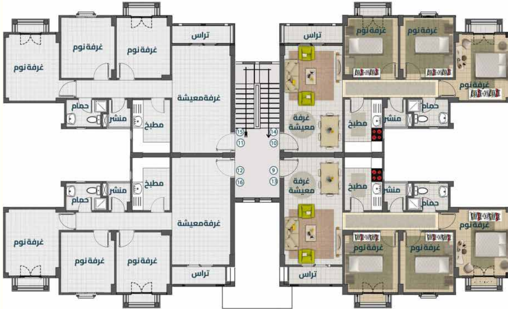
مسقط أفقي للدور (الثاني - الثالث)