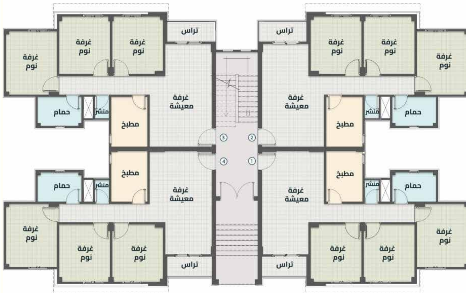
مسقط أفقي للدور (الأرضي)