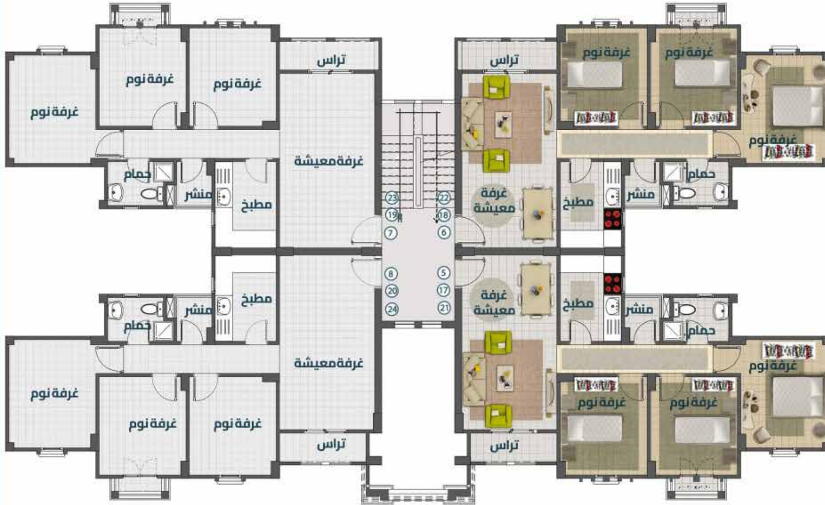
مسقط أفقي للدور (الأول - الرابع - الخامس)